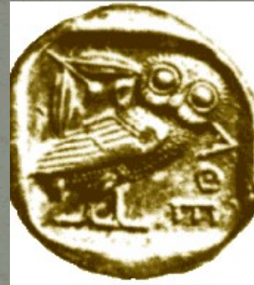
Une des premières pièces de la Grèce Antique

Beaucoup de termes, parfois encore actuels, rappellent la relation entre la monnaie et le poids: la livre, le peso et la peseta, par exemple.